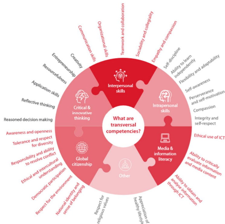
Figura 1: Competencias transversales 1

Las principales categorías de competencias transversales consideradas en el proyecto siguen un enfoque que la UNESCO sugiere e incluye: habilidades interpersonales, habilidades intrapersonales, pensamiento crítico e innovador, ciudadanía global y alfabetización en medios e información.